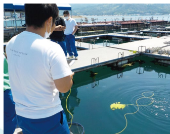
水中ドローン操縦