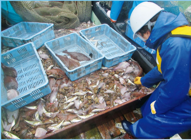
底びき網漁業実習