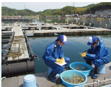
トリガイ養殖実習